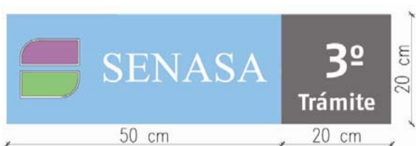
Ejemplo: Gráfico N° 3.1.

4. Carteles informativos de los distintos Organismos sobre trámites a realizar.