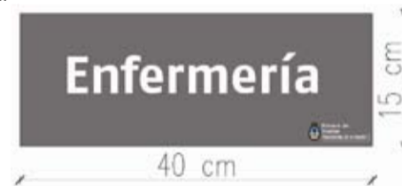
Gráfico N° 5.2.