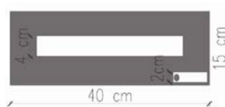
Gráfico N° 5.1.