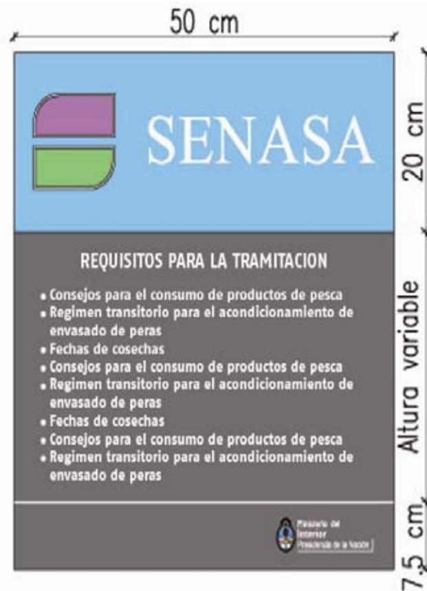
Gráfico N° 4.2.

5. Carteles que indican: enfermería, escalera, sanitarios, sala de reuniones, restrictivos, etc.